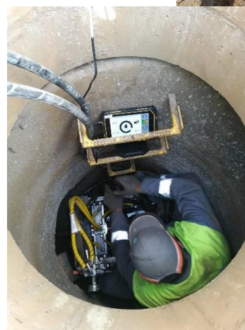
(УМ-20 работа из метрового колодца)